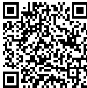
Catholic Welfare Services

BAIK - Sila teruskan untuk membantu 'Catholic Welfare Services' secara kewangan dalam pelayanan kita kepada golongan miskin dan yang memerlukan di dalam masyarakat kita tanpa mengira bangsa atau kepercayaan. Umat boleh membuat sumbangan melalui S Pay Global dengan mengimbas QR kod di sini. Sahkan bahawa penerima ialah 'Catholic Welfare Services' sebelum pemindahan dilakukan. Umat paroki juga boleh melakukan pemindahan dalam talian atau deposit tunai kepada akaun berikut: