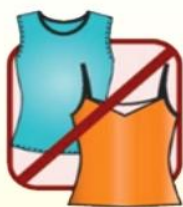
无袖/深V领口及 露肚装