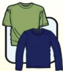
圆领长袖或 短袖衬衫或T恤