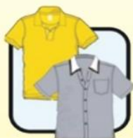
有领或端庄 整齐服饰