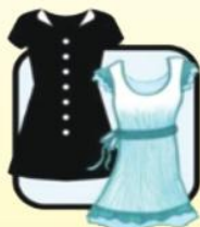
有袖连衣裙 (裙长过膝)