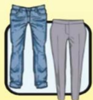
休闲长裤 或西装长裤