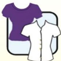
圆领/有领长袖或 短袖衬衫或T恤